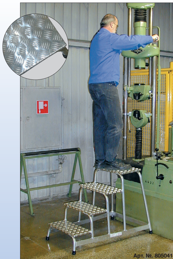
Арт. №. 805041